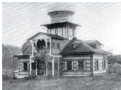
Здравнево, имение Репина