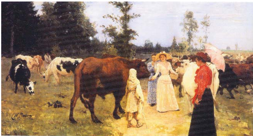
«Барышни на прогулке среди стада коров», 1896.

Когда берешь их в руки и каждую с трепетом рассматриваешь, то в голову приходят разные мыс-