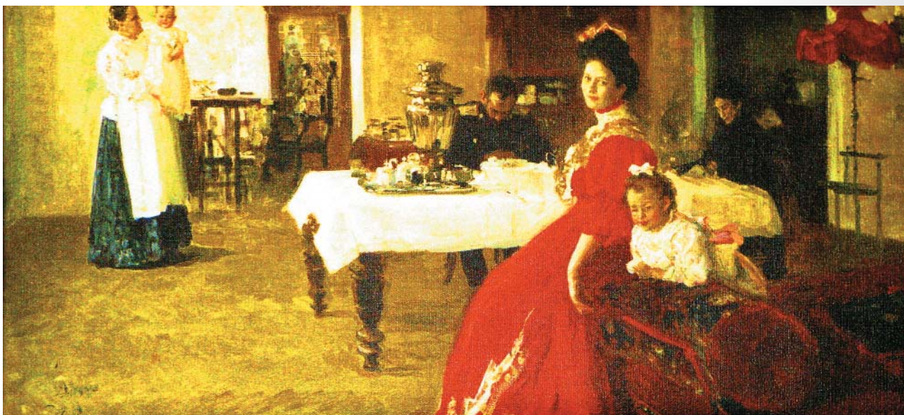
И.Е. Репин «Семейный портрет», 1905

Веселые лица мамы и маленькой Тани и опущенная голова отца семейства. Случайно это или нет, трудно сказать, но вскоре супруги расстались... Татьяна Ильинична целиком и полностью посвятит свою жизнь семье, матери, а потом и семье своей уже теперь единственной дочери Тасеньки.