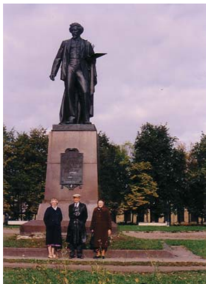
У памятника И.Е. Репину

призвания». Есть еще новое поколение, пятое, поколение трижды правнуков, они сейчас на пути становления их жизней. Будет ли новый гений или нет, этого никто не знает. Невозможно ни предсказать, ни предугадать секунду его рождения.